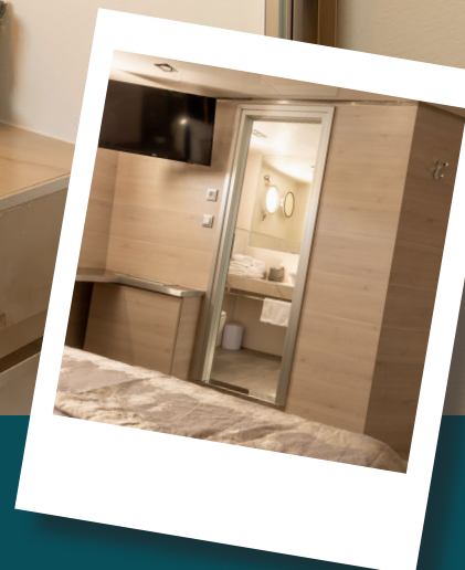
Badkamers: Grote Douche cabine met regendouche, wastafel en toilet.